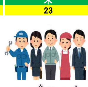
木 23 勤労感謝の日