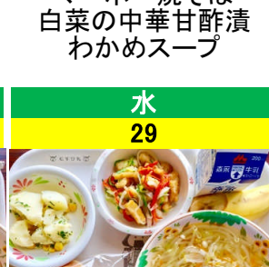
水 29 米粉スウィートパン イカのマリネ コーンポテト ジュリアンスープ 果物(バナナ)