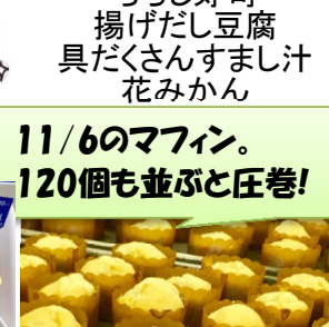
11/6のマフィン。 120個も並ぶと圧巻!