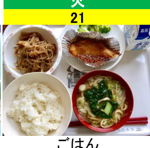
火 21 ごはん さばのみそ焼 付け合わせ 五目きんぴら なめこ汁