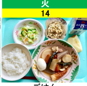
火 14 ごはん スタミナ納豆 かぶの香り漬 おでん 果物(りんご)