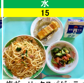
水 15 塩ガーリックスパゲッティ 海藻サラダ スティックスウィートポテト