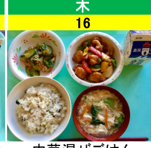
木 16 中華混ぜごはん 鶏肉とカシューナッツの炒めもの キムチの磯辺あえ かきたまスープ