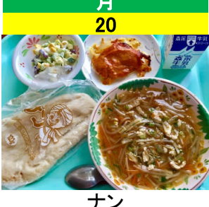
月 20 ナン タンドリーチキン ビーンズサラダ たけのこもやしのスープ