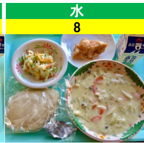
水 8 米粉フォカッチャ 鶏肉のレモン煮 コールスローサラダ マカロニのクリーム煮