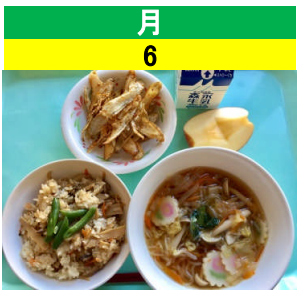
月 6 中華おこわ ごぼうの甘からめ 白玉汁 果物(りんご)