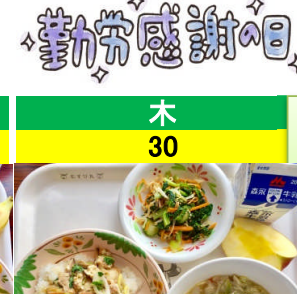
木 30 油麩丼 小松菜の生姜あえ みそけんちん 果物(りんご)