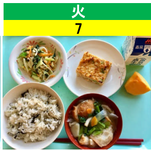
火 7 ノリノリごはん 千草焼 ほうれん草のピーナッツあえ おみおつけ 果物(柿)