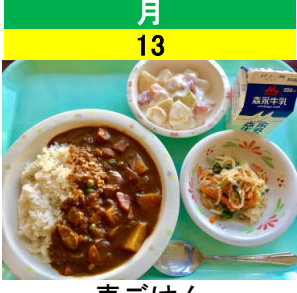
月 13 麦ごはん ポークカレー 水菜とツナのサラダ フルーツのヨーグルトあえ