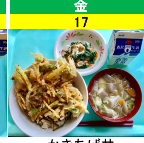
金 17 かきあげ丼 おろしあえ いものこ汁