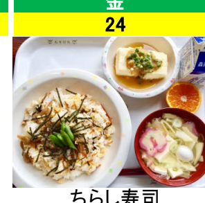
金 24 ちらし寿司 揚げだし豆腐 具だくさんすまし汁 花みかん