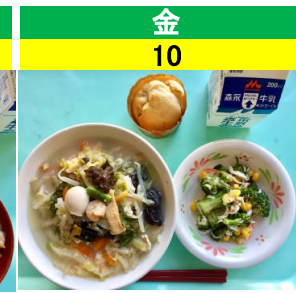
金 10 ちゃんぽんうどん 大根の磯辺サラダ 手作りりんごマフィン