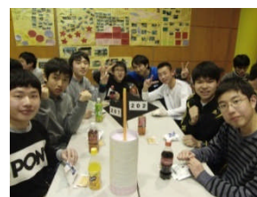
最高の仲間たちと!!