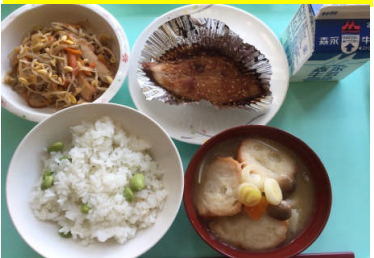
枝豆ごはん さばのみそ焼 豆もやしの炒り煮 おみおつけ