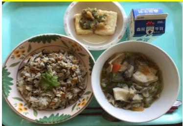
カラフルひじきごはん あげだし豆腐 せんべい汁