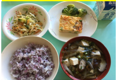
ゆかりごはん 五目卵巻 付け合わせ もやしのあえもの 沢煮椀