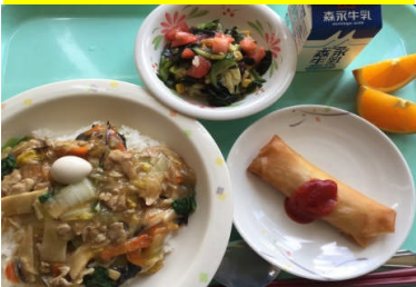
中華飯 手作リツナチーズ春捲 海藻サラダ 果物(オレンジ)