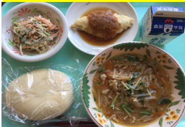
米粉フォカッチャ 魚のオニオンガーリック 切干大根のりゴマネーズサラダ たけのこと豚肉のスープ