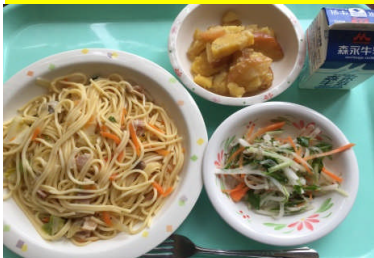
春キャベツの和風スパゲッティ 大根のペペロンサラダ さつまいもとりんごの重ね煮