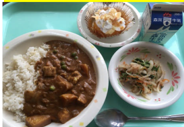
麦ごはん ポークカレー 水菜とツナのサラダ モンブランピーチ