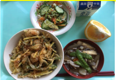
かき揚げ丼 ゆかり漬 おくずかけ 果物(甘夏みかん)