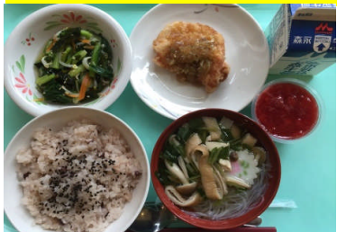
赤飯 南蛮だれのねぎまぶしから揚 生姜あえ すまし汁 ブラマンジェいちごソースがけ