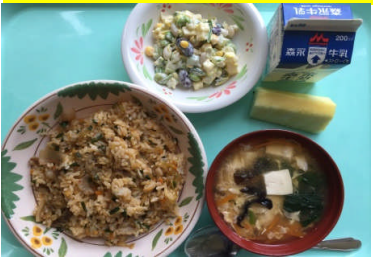
キムカルチャーハン ビーンズサラダ かきたまスープ 果物(パイン)