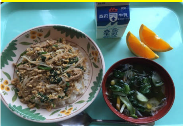
ビビンバ(韓国風三色丼) わかめスープ 果物(オレンジ)