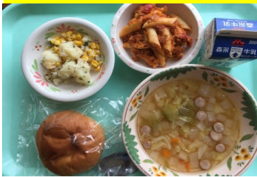
米粉スウィートパン ペンネのトマトソース煮 コーンポテト マセドアンスープ