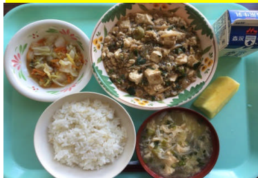
発芽玄米ごはん 本格マーボー豆腐 白菜の甘酢中華漬 中華卵スープ 果物(パイン)